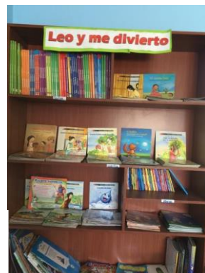
Algemene leesboeken en boeken met informatie