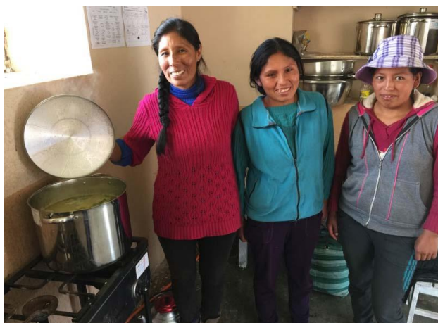
Kokende moeders met hieronder het menu van de week