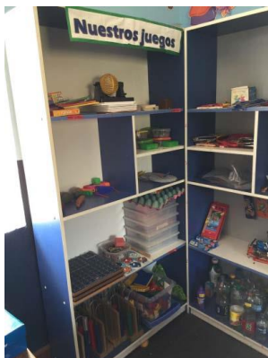
Didactische spelletjes voor verschillende leeftijden