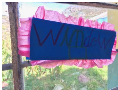
Er wordt nu zelfs ook Engels geleerd!