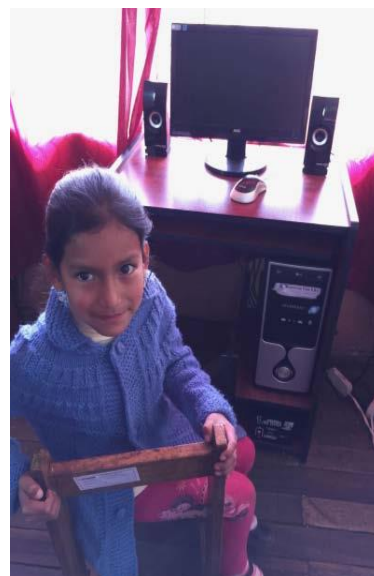
Afgedankte computers die opgeknapt werden. Hopelijk komt er ook nog een toetsenbord bij ...