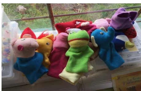
Speelgoed om creativiteit en sociale vaardigheden te stimuleren